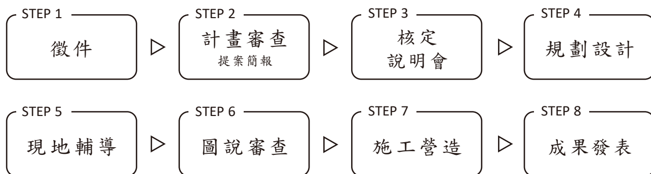
圖 1 計畫執行流程圖

以影像記錄執行過程，並透過記者會或其他形式，公開發表本案成果，介紹合作學校之原住民族文化學習場域營造成效，作為計畫示範學校。