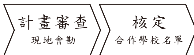
圖 3 徵選流程